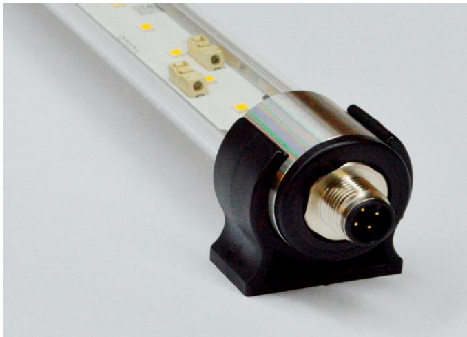
Montagebeispiele sample for mounting