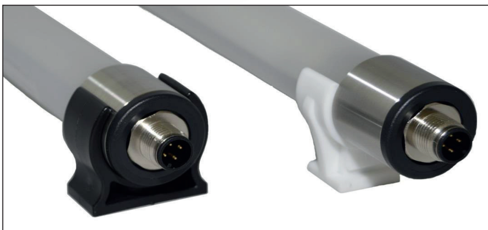
Montagebeispiele sample for mounting